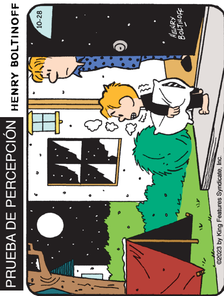
Encuentra las 6 diferencias entre los paneles