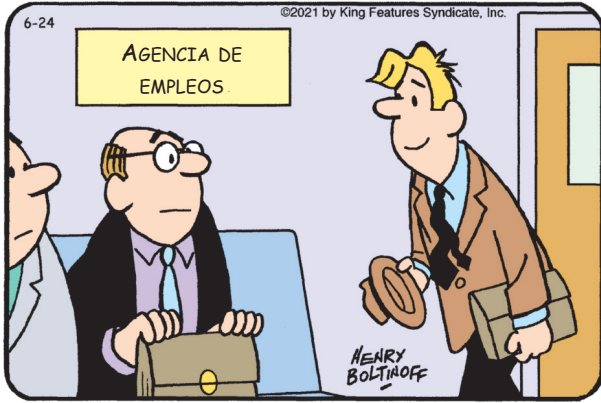
Encuentra las 6 diferencias entre los paneles