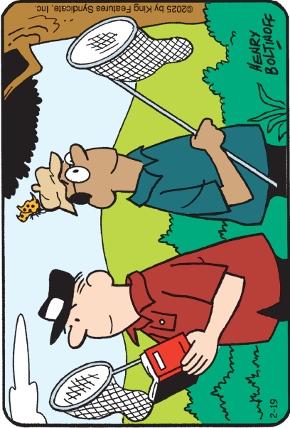
Encuentra las 6 diferencias entre los páneles