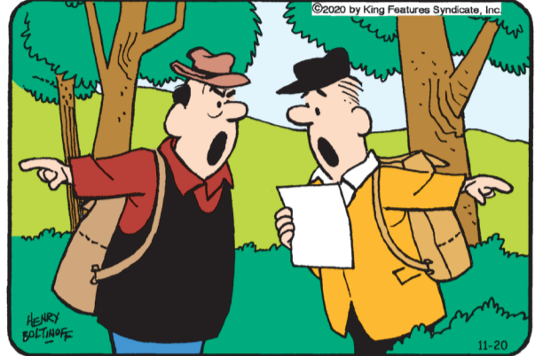
Encuentra las 6 diferencias entre los paneles