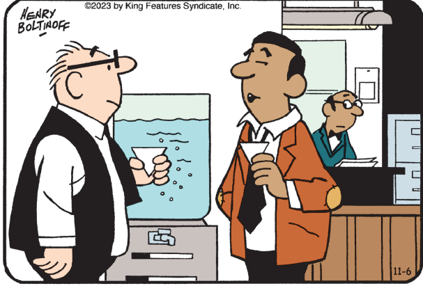
Encuentra las 6 diferencias entre los paneles