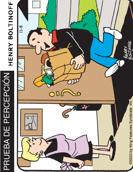
Encuentra las 6 diferencias entre los paneles