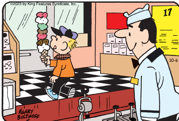
Encuentra las 6 diferencias entre los paneles