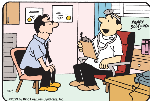
Encuentra las 6 diferencias entre los paneles