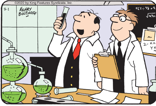
Encuentra las 6 diferencias entre los paneles