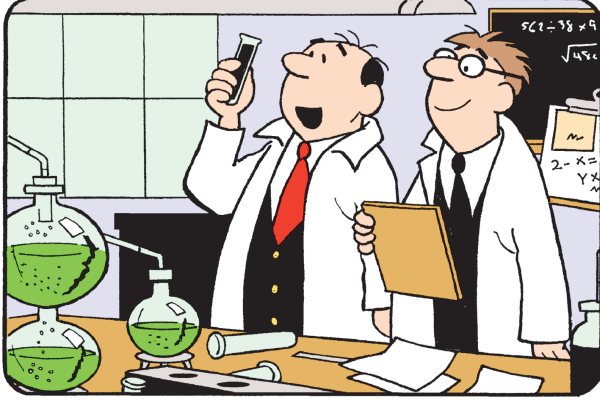
Diferencias: 1. La manga es más larga. 2. El chaleco es distinto. 3. El tubo de ensayo es más corto. 4. Falta el clip del portapapeles. 5. Falta el bolsillo. 6. Falta una solapa.