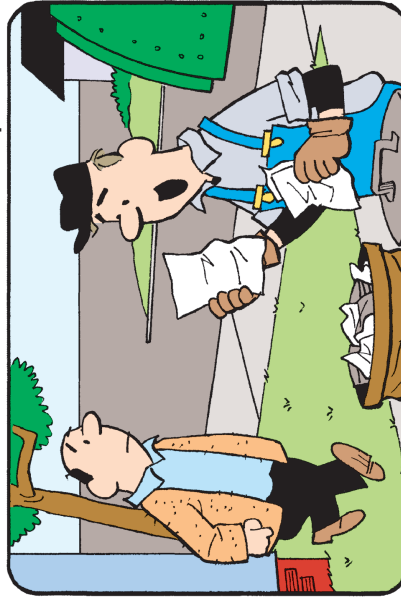
Diferencias: 1. El asa de la tapa es más chica. 2. No se ve la llanta del camión. 3. El tirante está movido. 4. No se ve el brazo. 5. El papel de la mano es más largo. 6. La gorra está volteada.