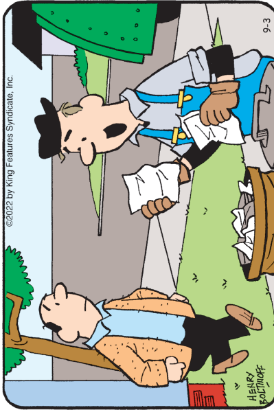
Encuentra las 6 diferencias entre los paneles